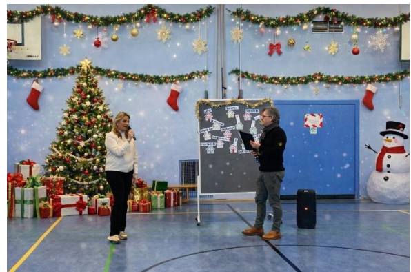
(Hintergrund mit der KI verändert)

Auch in diesem Jahr erfreuen sich die Klassen 5 und 6 an einem lebendigen und einem umgekehrten Adventskalender. Wichtel Werni hat schöne Adventsgeschichten mitgebracht und erzählt Euch viele schöne Geschichten rund um Familie, Traditionen, Werte und vielem mehr. Insgesamt gab es 15 schöne Geschichten, die von unseren Kolleginnen und Kollegen vorgetragen wurden.